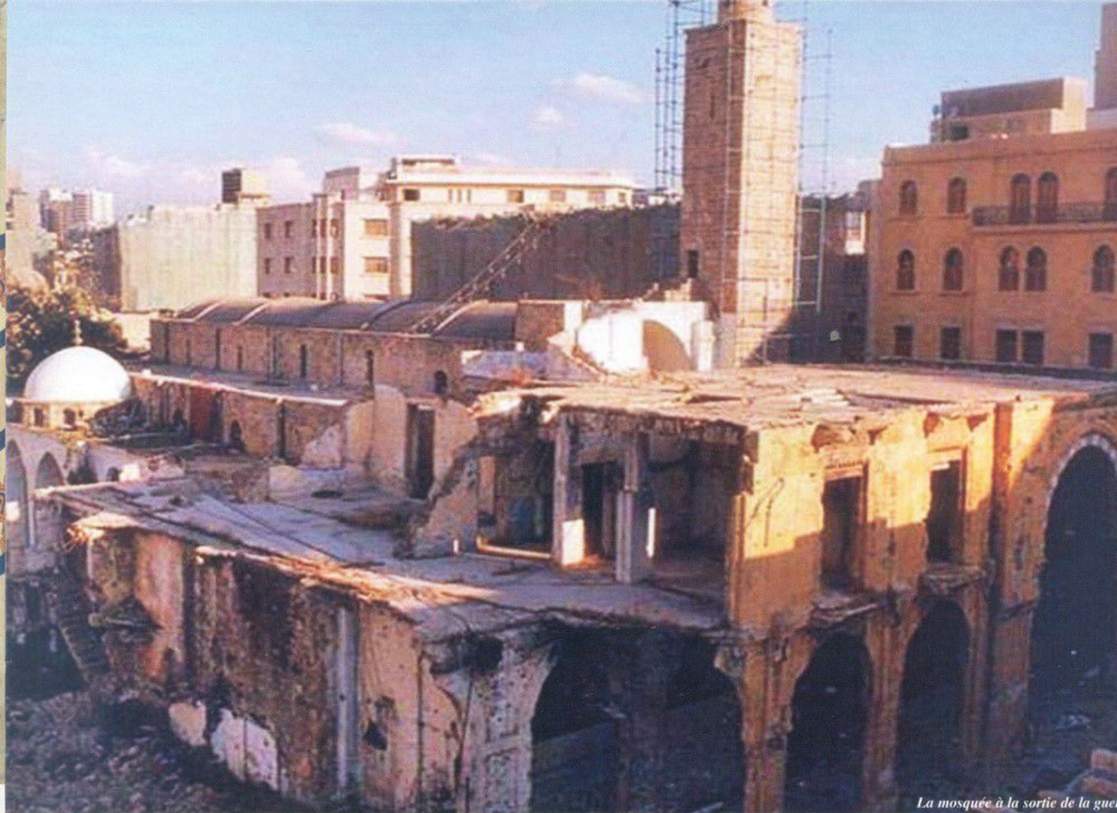
La mosquée à la sortie de la guerre.