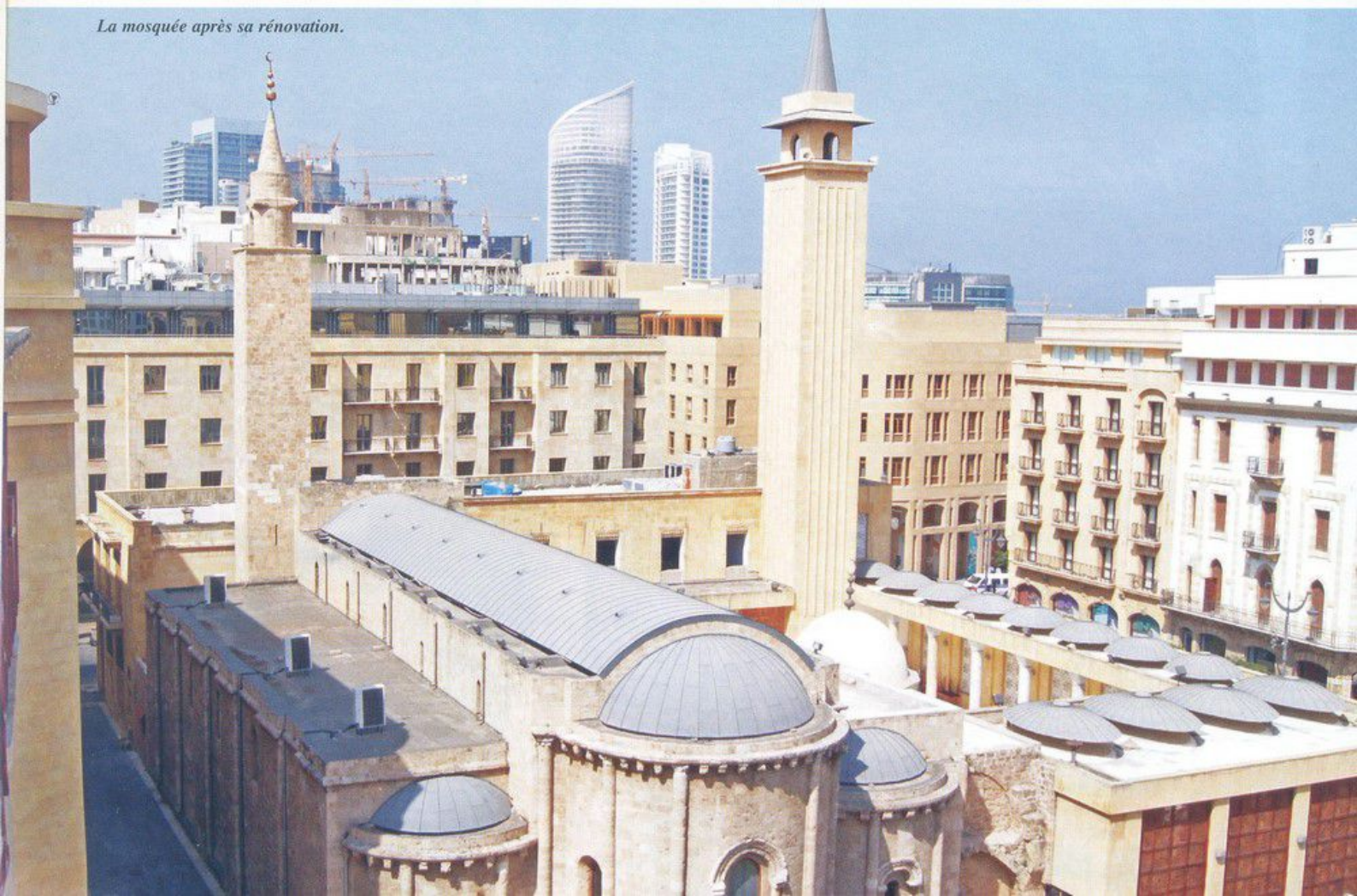
La mosquée après sa rénovation.