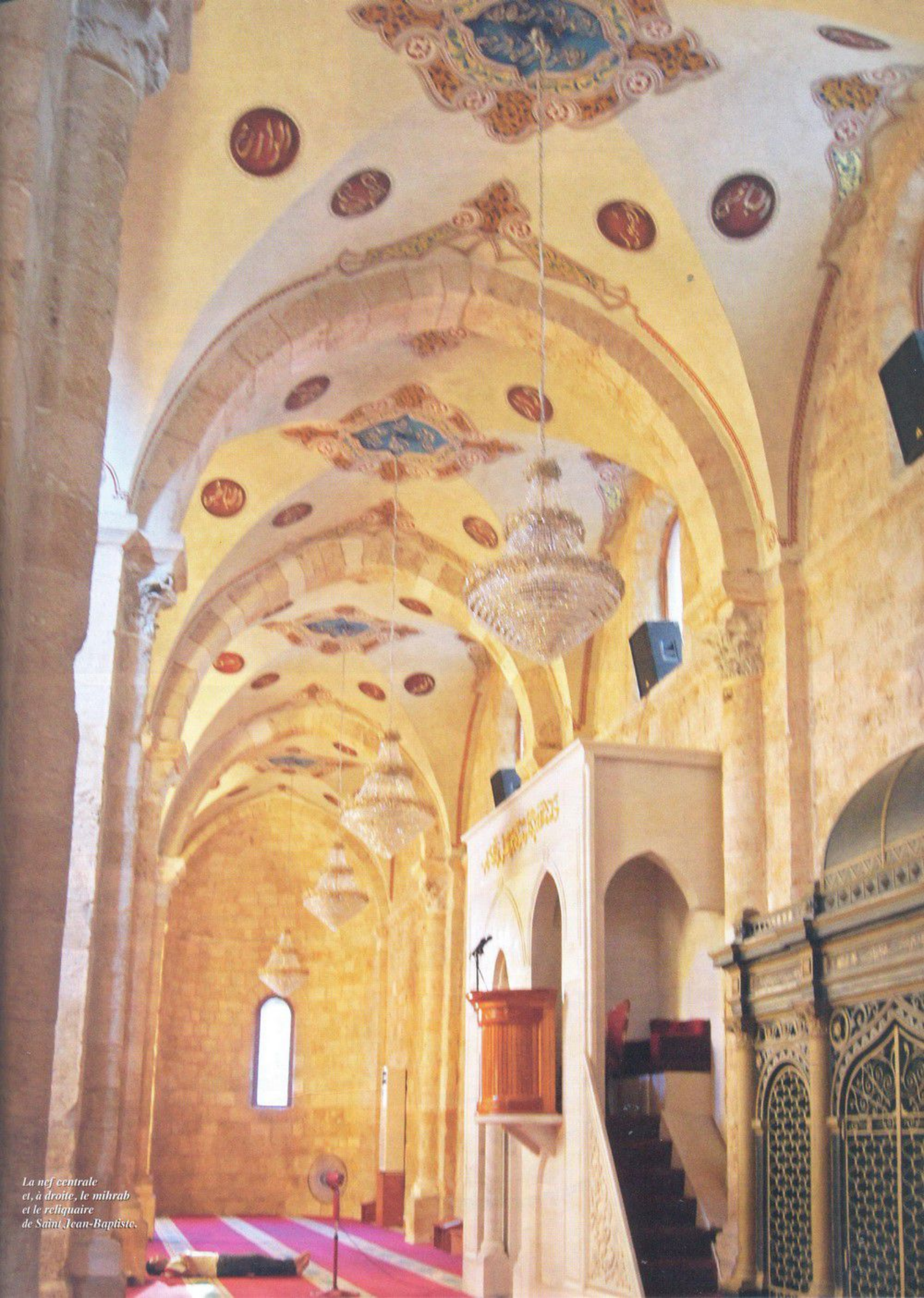
La nef centrale et, à droite, le mihrab et le reliquaire de Saint Jean-Baptiste.